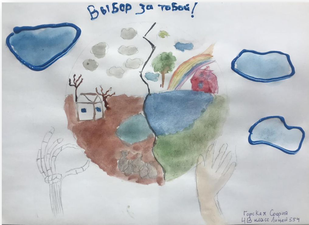
Горская София 4-В