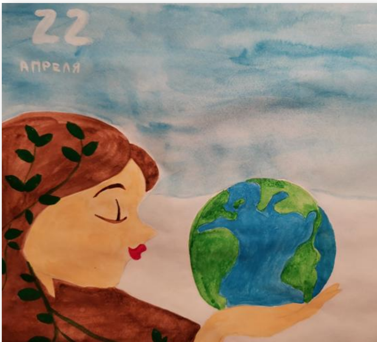
Барбулат Алена 4 -В

Свое отношение к проблемам планеты Земля, заботу о ней, решение проблем они выразили в своих рисунках!