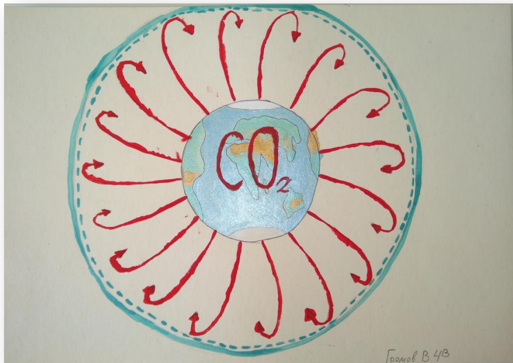
Громов Вася 4-В