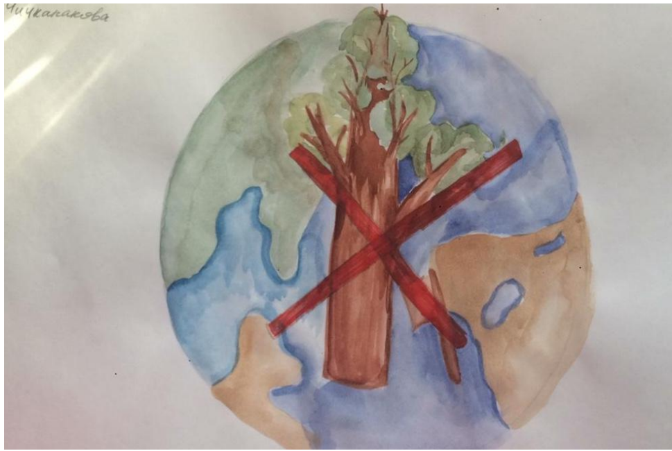
Чичканакова Наташа 4-В