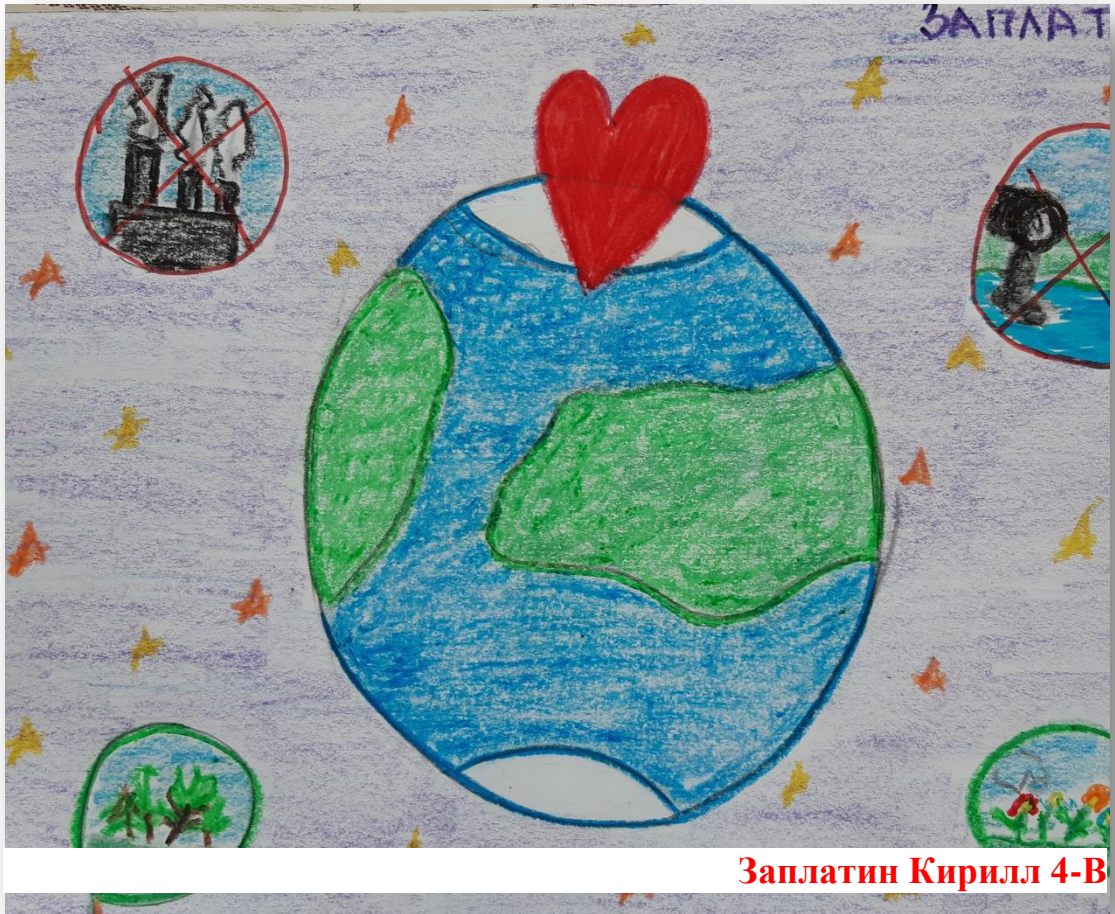
Заплатин Кирилл 4-В